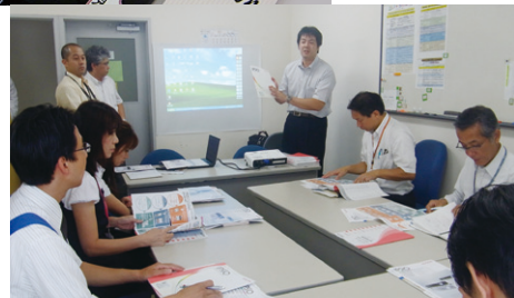
商品知識を深めるための勉強会風景