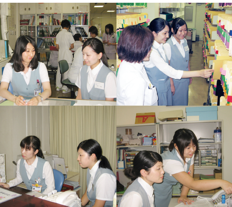
熱心に研修に励む実習生と指導する社員

各現場において、医療人として、社会へ出て行く一歩手前の大事な実習が、実りある良い思い出となるよう協力しております。