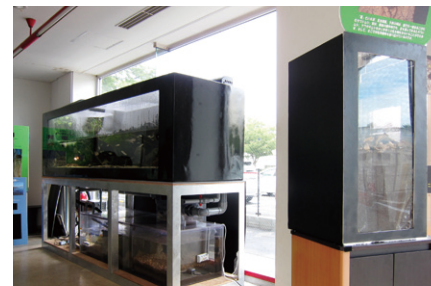
クレセントに設置されたミニ水族館

北里研究所・北里大学等事務室と、北里関連会社としての相互理解及び親睦を図る目的で、事務室を紹介させて頂くコーナーを設けました。第一回目は、三陸キャンパスから相模原キャンパスへ、一時移転の海洋生命科学部事務室からのメッセージです。