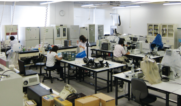
S号館に移転・整備された研究室

事務室構成で、極めて住み心地の良い職場と自認しておりますが(ただし、このことを他人に聞いたことはないのですが、これも勝手な感想にすぎないのですが)、それがどのように変わるのか、メンバーが揃ってからまだ3~4ヶ月ですので、このあとを楽しみにしています。