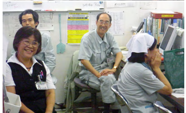
上:大学病院施設部事務所/下:東病院施設部事務所