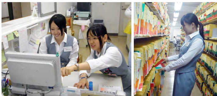
熱心に研修に励む実習生と指導する社員