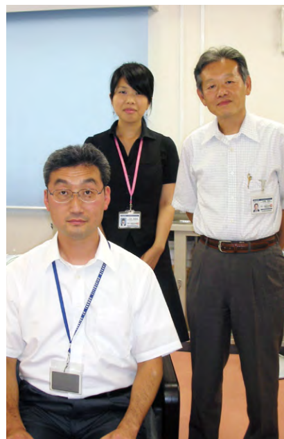
看護キャリア開発・研究センターの面々