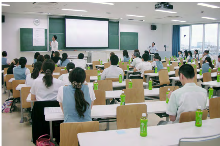
外部講師による研修風景