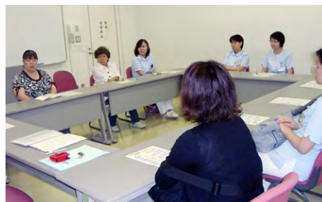
看護補佐フォローアップ研修