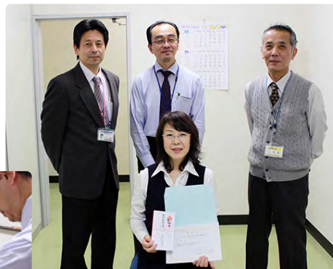
11月28日に表彰式が行われました