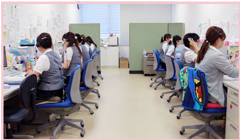
忙しくて手が離せません!

今後の課題としては、電話予約センターの電話が繋がらない件数が、特に月末月初、週初めに多いので、迅速かつ正確に対応出来るよう努力していきたいです。