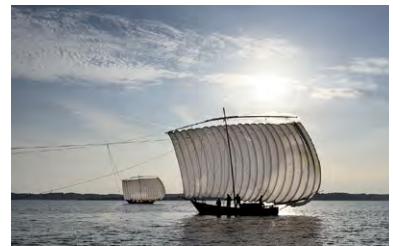
曳船が運航しています。

名産は鰻、ワカサギ、醤油、蓮根などです。東京から1時間程で心癒される風景に出合えますので、休日に出かけてみてはいかがでしょうか。