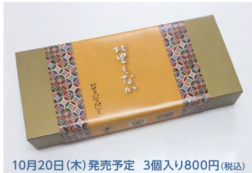
10月20日(木) 発売予定 3個入り800円(税込)