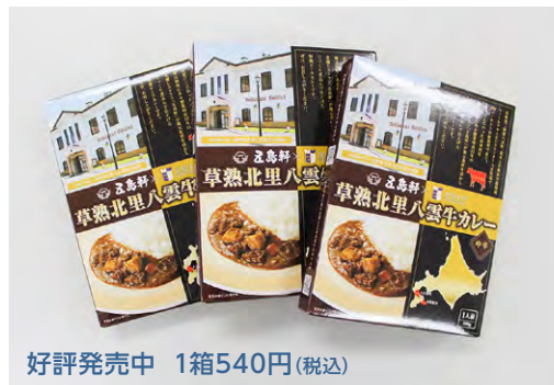
好評発売中 1箱540円(税込)

新しくなった『草熟北里八雲牛カレー』は、100%自給飼料を使い八雲牧場で育てた牛の、品質にこだわった赤身肉を、函館にある老舗レストラン『五島軒』とコラボレーションし、地元食材を活かしてじっくりと煮込んで仕上げた特製ビーフカレーです。ぜひお召し上がりください。