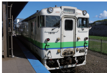
廃線になる前のJR江差線

残念ながらJR江差線は廃線となってしまいましたが、一度訪れてみてはいかがでしょうか。