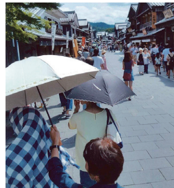
おはらい町・おかげ横丁