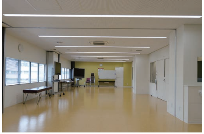
5階:臨床スキルスラボ