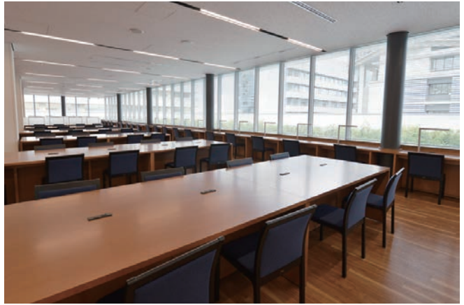
4階:臨床教育研究棟図書館