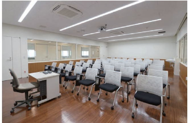
5階:臨床スキルスラボ