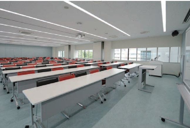
5階:チーム医療演習室