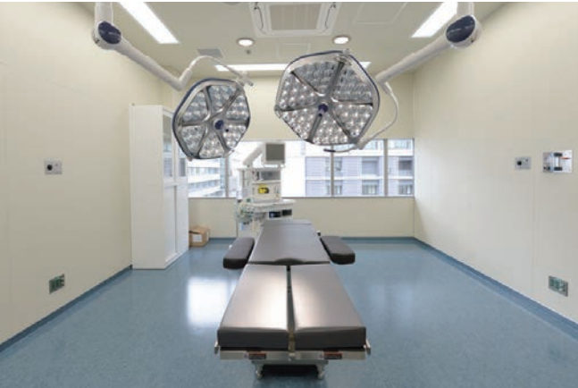
5階:臨床スキルスラボ