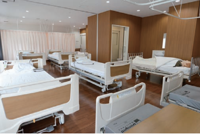
5階:臨床スキルスラボ