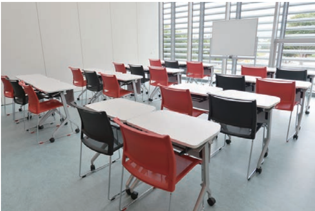
3階:チーム医療演習室