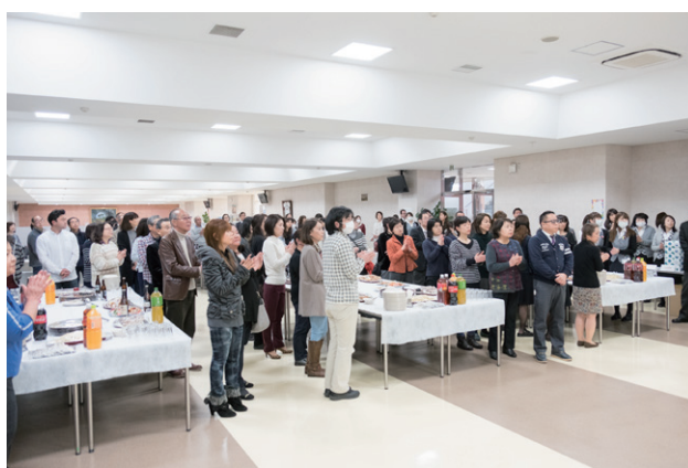
ライフアワード2016の様子から

第6回となるライフアワードの実施が経営会議で承認されました。実行委員を決めて、これから具体的な計画を立てて行きますので、よろしくお祈りします。