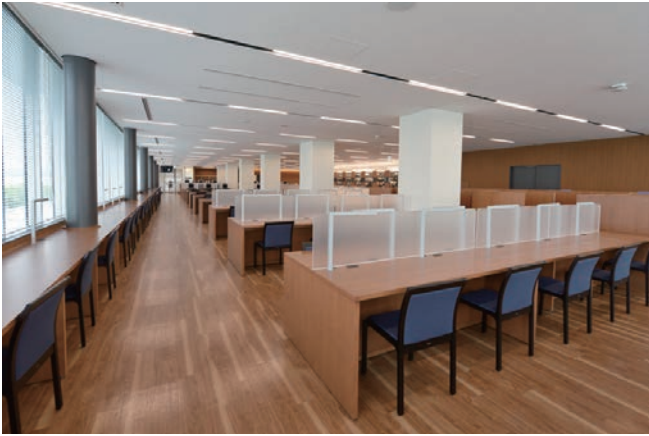
4階:臨床教育研究棟図書館