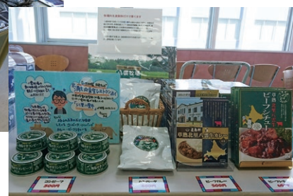
北里早熟八雲牛食品